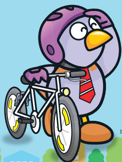
埼玉県マスコット 「コバトン」